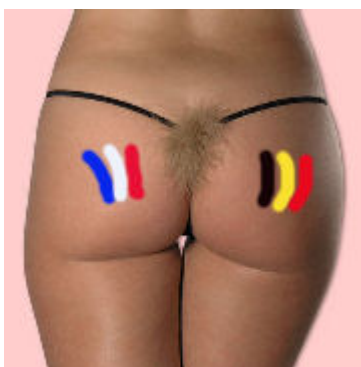
Le Grand Maître

« C'est entre la France et la Belgique que se trouve le Fondement de l'Europe »